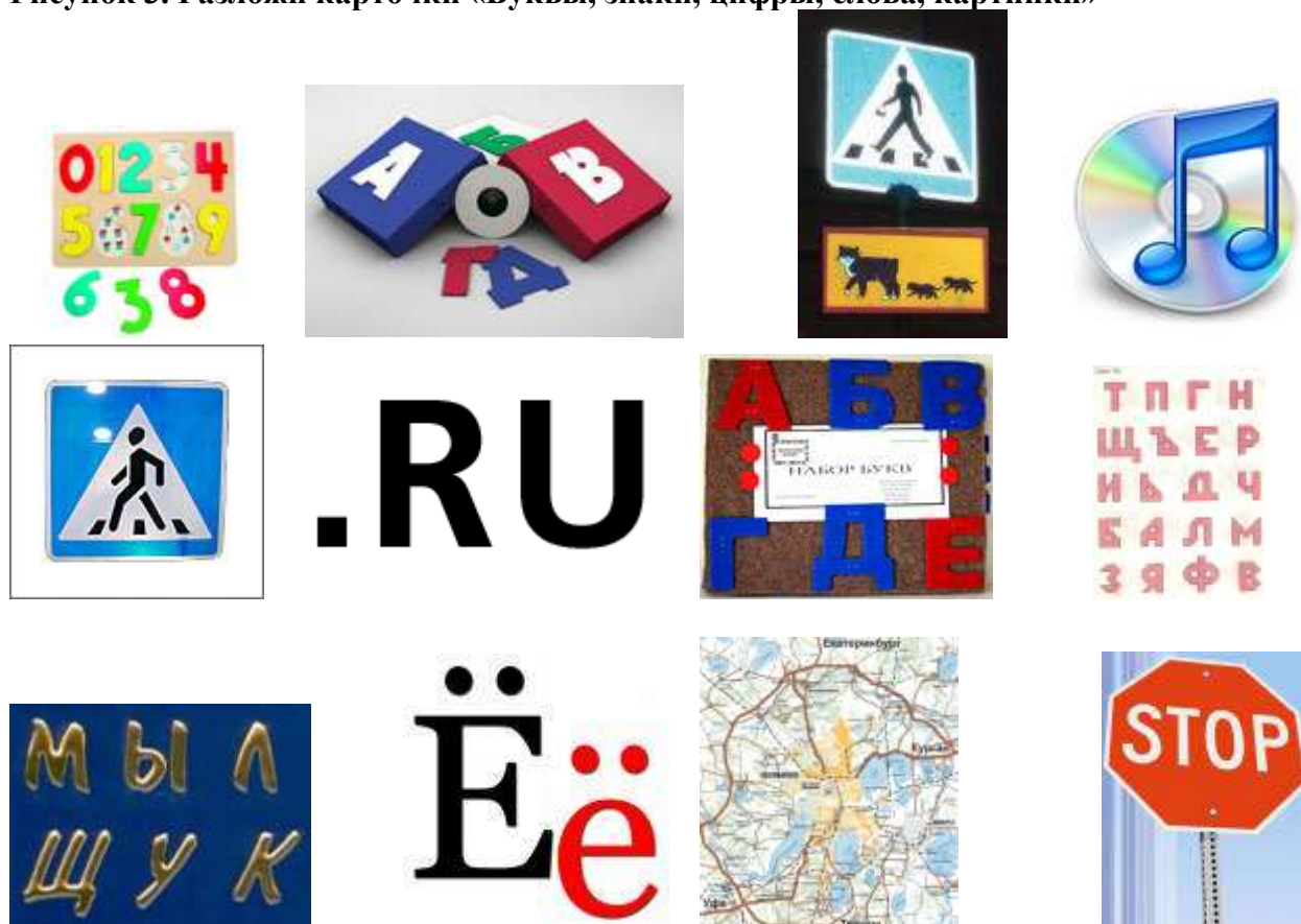
Рисунок 3. Разложи карточки «Буквы, знаки, цифры, слова, картинки»